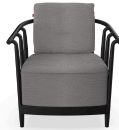
Fauteuil Raff Lounge Noche Coussin Smoke 07050