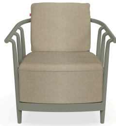
Fauteuil Raff Lounge Salvia avec coussin Limonetto 07049