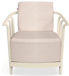
Fauteuil Raff Lounge Nacar avec coussin Hazelnut 07048