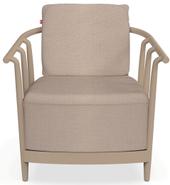
Fauteuil Raff Lounge Duna avec coussin Mud 07047