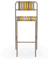
Tabouret Gelato Nocciola Duna 07286..2X.