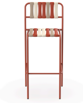
Tabouret Gelato Amarena Greda 07285..2X.