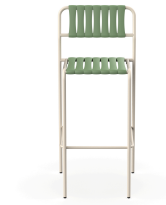
Tabouret Gelato Nacar + Lattes Olivo 06957..2X.