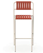
Tabouret Gelato Nacar + Lattes Greda 06960..2X.