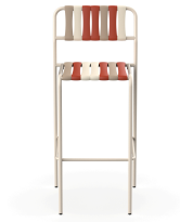
Tabouret Gelato Amarena Nacar 06927..2X.