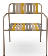
Fauteuil Lounge Gelato Nocciola Duna 07283..2X.