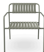
Fauteuil Lounge Gelato Salvia + Lattes Salvia 06976..2X.