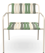
Fauteuil Lounge Gelato Pistacchio Nacar 06922..2X.