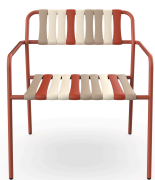
Fauteuil Lounge Gelato Amarena Greda 07282..2X.