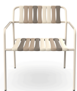
Fauteuil Lounge Gelato Toroncino Nacar 06924..2X.