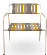
Fauteuil Lounge Gelato Nocciola Nacar 06925..2X.