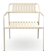
Fauteuil Lounge Gelato Nacar + Lattes Nacar 06975..2X.