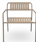
Fauteuil Lounge Gelato Duna Lattes Duna 07292..2X.