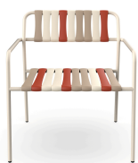
Fauteuil Lounge Gelato Amarena Nacar 06923..2X.