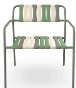
Fauteuil Lounge Gelato Pistacchio Salvia 07281..2X.