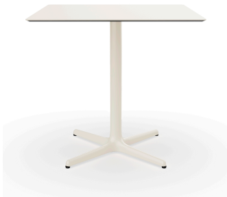
Table Toledo 80x80 ivoire 06613