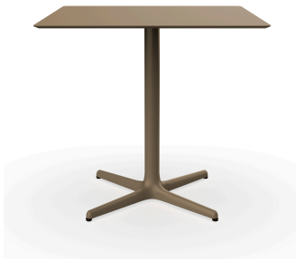
Table Toledo 80x80 Chocolat 06614