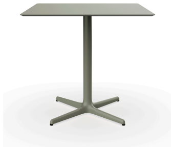
Table Toledo 80x80 gris verdâtre 06612