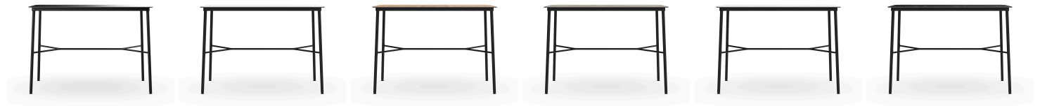
Table haute Hub Black 150x70 Hpl Noir 06463