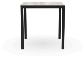
Table Barcino 70x70 Compact Bois Delavé/Noire 04021