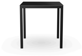
Table Barcino 70x70 Compact Noire/Noir 03031