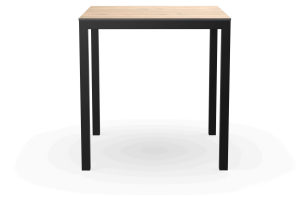
Table Barcino 70x70 Compact Chêne Naturel/Noire 04023