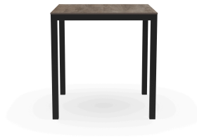
Table Barcino 70x70 Compact Chêne Cendré/Noire 04022