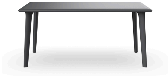
Table New Dessa 160x90 Gris Foncé 03946