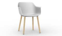
Silla Shape Wood Blanco 05309