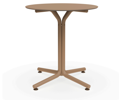
Table Bini Sable Hpl Sable Ø70 06638