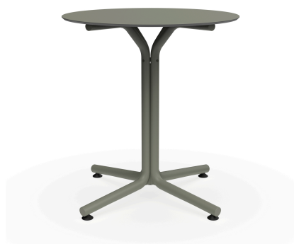
Table Bini Gris Vert Hpl Gris Vert Ø70 06074