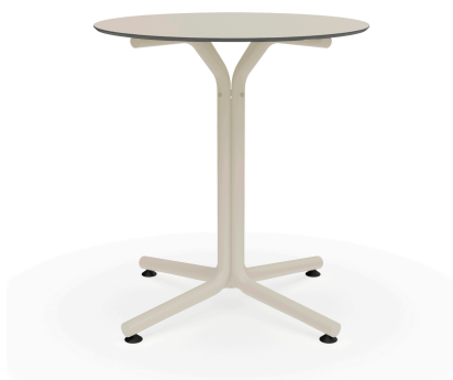
Table Bini Ivoire Hpl Ivoire Ø70 06075