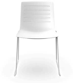
Silla Patin Skin Blanca 03458