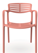
Chaise Toledo Aire Rosal 06837