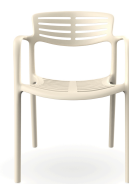
Chaise Toledo Aire Nácar 06834