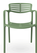
Chaise Toledo Aire Olivo 06839