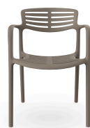
Chaise Toledo Aire Trufa 06833