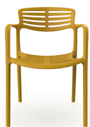
Chaise Toledo Aire Albero 06836