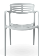
Chaise Toledo Aire Luna 06840