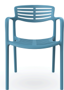
Chaise Toledo Aire Marina 06835