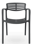
Chaise Toledo Aire Roca 06830