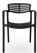
Fauteuil Toledo Aire Noche 06831