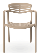
Chaise Toledo Aire Duna 06829