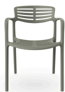
Chaise Toledo Aire Salvia 06832