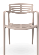
Chaise Toledo Aire Boletus 06841