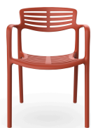
Chaise Toledo Aire Greda 06838