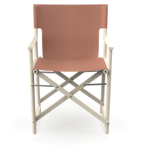
Fauteuil Boss Nácar en tissu Amber 06826