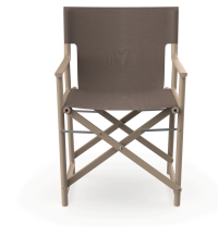
Fauteuil Boss Duna en tissu Mocha 06825