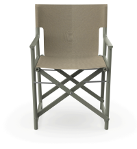
Fauteuil Boss Salvia en tissu Limonetto 06824