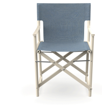
Fauteuil Boss Nácar en tissu Denim 06828