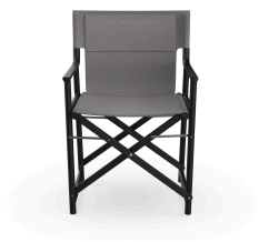
Fauteuil Boss Noche en tissu Smoke 06823