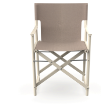
Fauteuil Boss Nácar en tissu Mud 06827