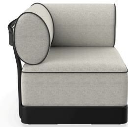
Brisa Corner Noche Coussin Salina 05 + Dolce 55 06800