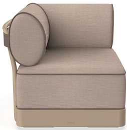
Brisa Corner Duna Coussin Mud + Mocha 06797