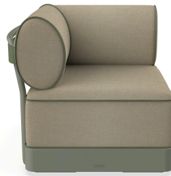
Brisa Corner Salvia Coussin Limonetto + Fern 06799