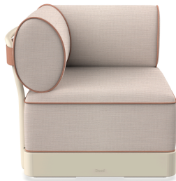
Brisa Corner Nacar Coussin Hazelnut + Amber 06798