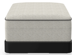
Brisa Ottoman Noche Coussin Salina 05 + Dolce 55 06792