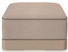
Brisa Ottoman Duna Coussin Mud + Mocha 06789