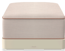
Brisa Ottoman Nacar Coussin Hazelnut + Amber 06790