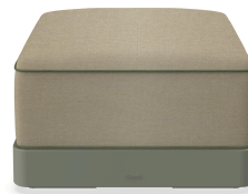
Brisa Ottoman Salvia Coussin Limonetto + Fern 06791