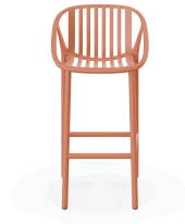
Tabouret Bini Haut en Terracotta 06541