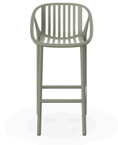
Tabouret Bini Haut en Gris Verdâtre 06539