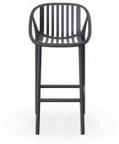
Tabouret Bini Haut en Gris Foncé 06538