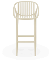
Tabouret Bini Haut en Ivoire 06540