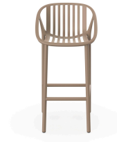
Tabouret Bini Haut en Couleur Sable 06543