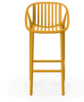
Tabouret Bini Haut en Toscan 06542