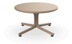
Table Bini Lounge Sable 05403