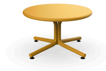
Table Bini Lounge Toscano 05402