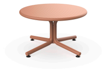
Table Bini Lounge Terre Cuite 05401