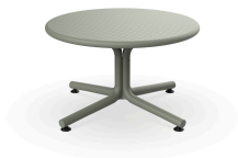
Table Bini Lounge Vert Grisâtre 05399