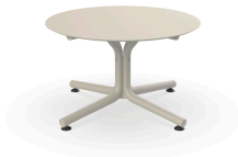
Table Bini Lounge Ivoire Hpl Ivoire Ø70 06083