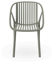
Chaise Bini Gris-Verte 05377