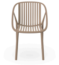
Chaise Bini Sable 05381