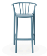
Tabouret Haut Woody Bleu Retro 05447