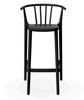
Tabouret Haut Woody Noir 05445