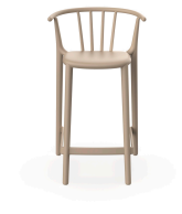
Tabouret Moyen Woody Sable 05457