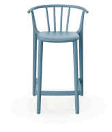
Tabouret Moyen Woody Bleu Retro 05455