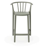
Tabouret Moyen Woody Gris-Vert 05456