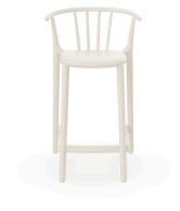
Tabouret Moyen Woody Ivoire 05452