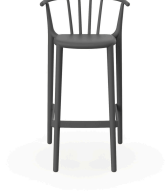
Tabouret Haut Woody Gris Foncé 05450