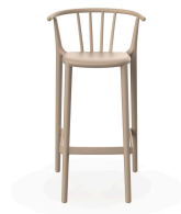
Tabouret Haut Woody Sable 05449