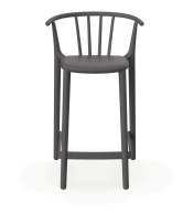
Tabouret Moyen Woody Gris Foncé 05458