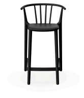
Tabouret Moyen Woody Noir 05453