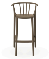
Tabouret Haut Woody Chocolat 05446