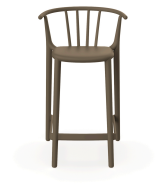
Tabouret Moyen Woody Chocolat 05454