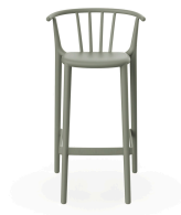
Tabouret Haut Woody Gris-Vert 05448