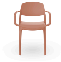
Fauteuil Smart Terra Cotta 05374