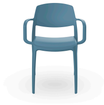
Fauteuil Smart Bleu Retro 05373