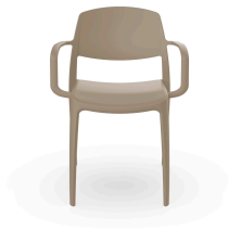
Fauteuil Smart Sable 05372