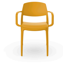
Fauteuil Smart Toscan 05375