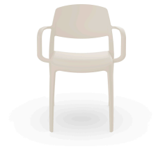
Fauteuil Smart Ivoire 07121