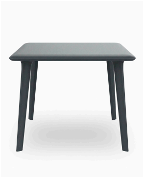
Table New Dessa 90x90 Gris Foncé 03944