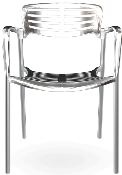
Fauteuil Toledo 70000