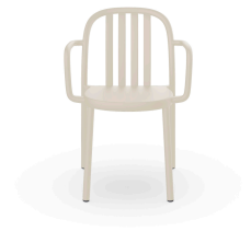
Fauteuil Sue Lamas Ivoire 07142