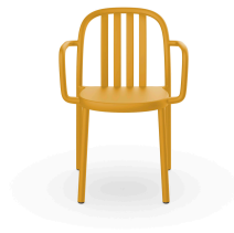
Fauteuil Sue Lamas Toscan 05177