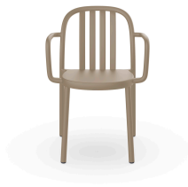
Fauteuil Sue Lamas Sable 05175