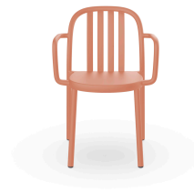
Fauteuil Sue Lamas Terra Cotta 05178