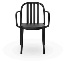
Fauteuil Sue Lamas Noire 05174