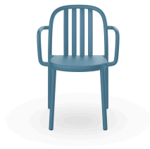
Fauteuil Sue Lamas Bleu Retro 05176