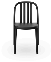
Chaise Sue Lamas Noire 05168