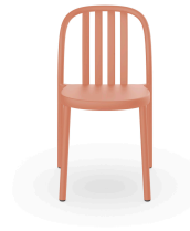
Chaise Sue Lamas Terra Cotta 05172