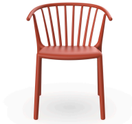
Chaise Woody Greda 07022