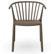
Chaise Woody Chocolat 04149