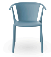
Chaise Woody Flat Bleu Retro 04028