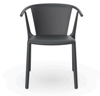
Chaise Woody Flat Gris Foncée 04024