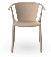
Chaise Woody Flat Sable 04026