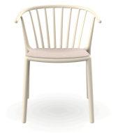
Chaise Woody Ivoire Assise tapissé Asgard Hazelnut 07092