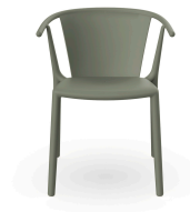
Chaise Woody Flat Gris Vert 06658