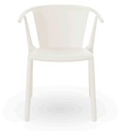
Chaise Woody Flat Ivoire 04025