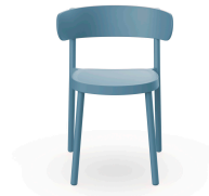
Chaise Casino Bleu Retro 03957