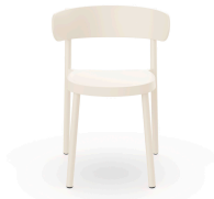
Chaise Casino Ivoire 03954