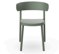
Chaise Casino Gris Vert 03958