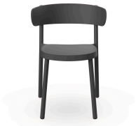
Chaise Casino Gris Foncée 03953