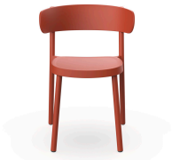
Chaise Casino Greda 07107