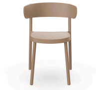
Chaise Casino Sable 03955