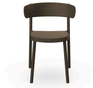
Chaise Casino Chocolat 03956