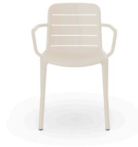
Fauteuil Gina Ivoire 07144