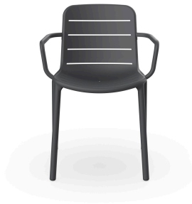
Chaise Gina Avec Accoudoirs Gris Foncé 05261