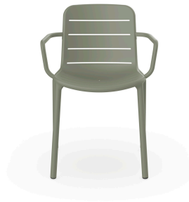
Fauteuil Gina Gris Verdâtre 06460