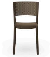
Chaise Spot Chocolat 01651