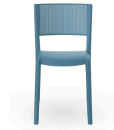
Chaise Spot Bleu Retro 04600