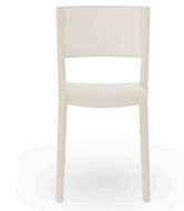
Chaise Spot Ivoire 07131