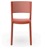
Silla Spot Greda 07132