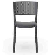
Chaise Spot Gris Foncé 03960