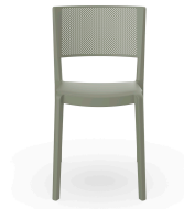
Chaise Spot Grise-Verte 04599