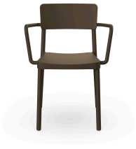
Fauteuil Lisboa Chocolat 00819