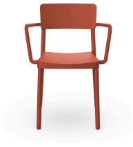
Fauteuil Lisboa Greda 07058