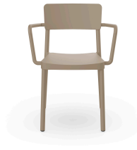
Fauteuil Lisboa Sable 00953