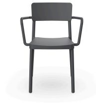
Fauteuil Lisboa Gris Foncé 00961