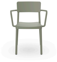
Fauteuil Lisboa Gris Vert 07057