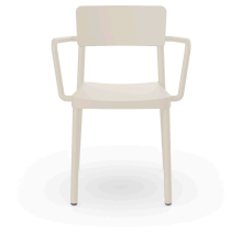
Fauteuil Lisboa Ivoire 07056