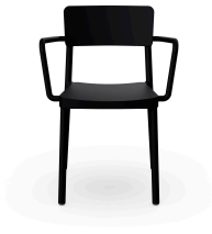
Fauteuil Lisboa Noire 00820