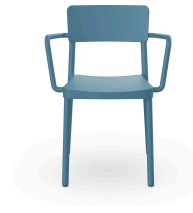
Fauteuil Lisboa Bleu Retro 05080