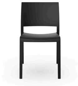
Chaise Fiona Noire 00764