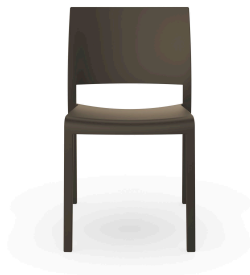
Chaise Fiona Chocolat 00770