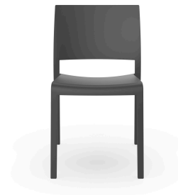
Chaise Fiona Gris Foncée 01802