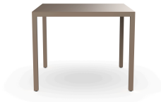
Table Barcino 90x90 Sable 01400