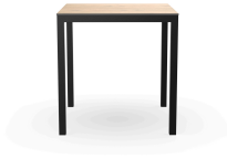
Table Barcino 70x70 Compact Chêne Naturel/Noire 04023