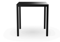
Table Barcino 70x70 Noire 01403