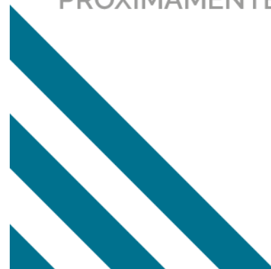
IMAGEN DISPONIBLE PRÓXIMAMENTE

CLICK-CLACK ha sido diseñado buscando líneas depuradas, de aspecto clásico, sobrio y atemporal, dando mayor importancia a las proporciones frente al exceso de detalles.