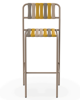
Gelato Stool Nocciola Duna 07286..2X.