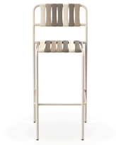
Gelato Stool Toroncino Nacar 06928..2X.