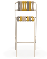
Gelato Stool Nocciola Nacar 06929..2X.