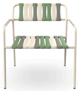
Lounge Armchair Gelato Pistacchio Nacar 06922..2X.