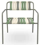
Lounge Armchair Gelato Pistacchio Salvia 07281..2X.