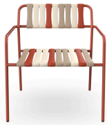
Lounge Armchair Gelato Amarena Greda 07282..2X.