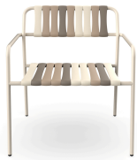
Lounge Armchair Gelato Toroncino Nacar 06924..2X.