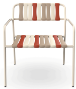
Lounge Armchair Gelato Amarena Nacar 06923..2X.