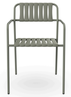
Silla Con Brazos Gelato Salvia + Lamas Salvia