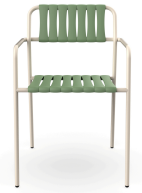
Silla Con Brazos Gelato Nacar + Lamas Olivo