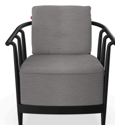
Sillon Raff Lounge Noche Cojin Smoke 07050