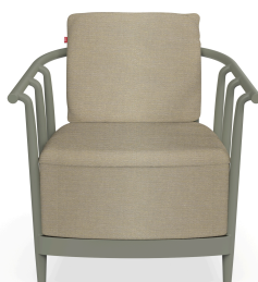
Sillon Raff Lounge Salvia Cojin Limonetto 07049