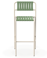
Taburete Gelato Nacar + Lamas Olivo 06957..2X.