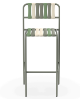
Taburete Gelato Pistacchio Salvia 07284..2X.