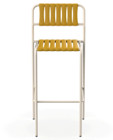
Taburete Gelato Nacar + Lamas Albero 06961..2X.