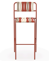
Taburete Gelato Amarena Greda 07285..2X.