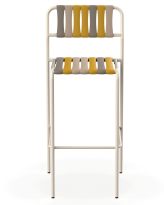
Taburete Gelato Nocciola Nacar 06929..2X.