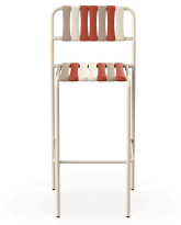
Taburete Gelato Amarena Nacar 06927..2X.