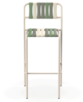
Taburete Gelato Pistacchio Nacar 06926..2X.