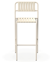
Taburete Gelato Nacar + Lamas Nacar 06978..2X.