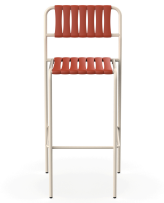
Taburete Gelato Nacar + Lamas Greda 06960..2X.