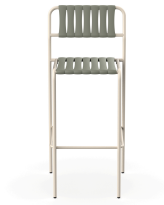
Taburete Gelato Nacar + Lamas Salvia 06956..2X.