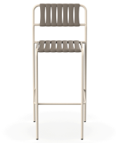
Taburete Gelato Nacar + Lamas Trufa 06959..2X.