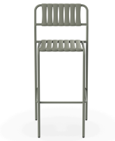
Taburete Gelato Salvia + Lamas Salvia 06979..2X.