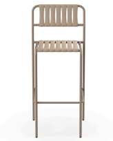
Taburete Gelato Duna Lamas Duna 07293..2X.