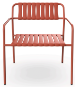
Sillon Gelato Greda + Lamas Greda 06977..2X.