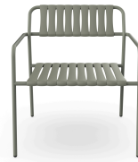
Sillon Gelato Salvia + Lamas Salvia 06976..2X.