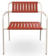
Sillon Gelato Nacar + Lamas Greda 06953..2X.