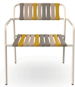
Sillon Gelato Nocciola Nacar 06925..2X.