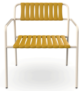
Sillon Gelato Nacar + Lamas Albero 06954..2X.