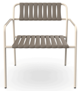
Sillon Gelato Nacar + Lamas Trufa 06952..2X.