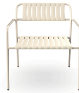
Sillon Gelato Nacar + Lamas Nacar 06975..2X.