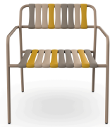
Sillon Gelato Nocciola Duna 07283..2X.