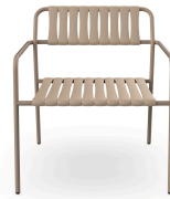
Sillon Gelato Duna Lamas Duna 07292..2X.