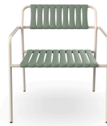
Sillon Gelato Nacar + Lamas Salvia 06949..2X.