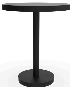
Mesa Barcino Ø60 Pie Central Negra 01432..1X.