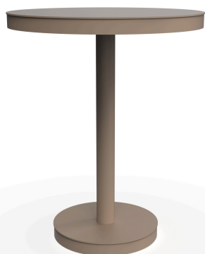
Mesa Barcino Ø60 Pie Central Arena 01431..1X.