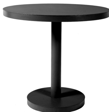
Mesa Barcino Ø80 Pie Central Negra 01424..1X.