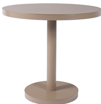
Mesa Barcino Ø80 Pie Central Arena 01423..1X.