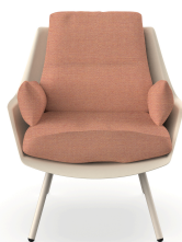
Butaca Anou Nacar Amber 07063..1X.