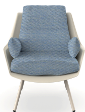
Butaca Anou Nacar Denim 07061..1X.