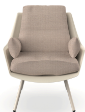
Butaca Anou Nacar Mud 07062..1X.