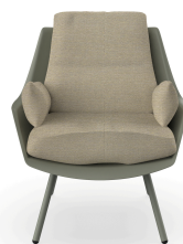
Butaca Anou Salvia Limonetto 07064..1X.