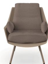
Butaca Anou Duna Mocha 07065..1X.