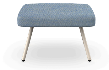
Pouf Anou Nacar Denim 07069..1X.