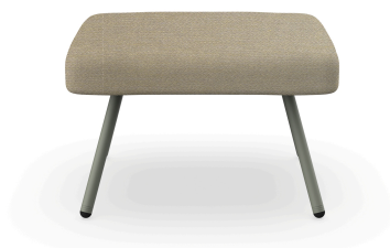
Pouf Anou Salvia Limonetto 07072..1X.