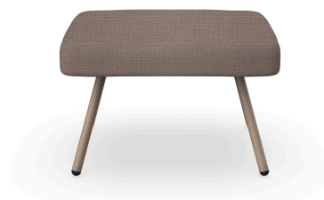
Pouf Anou Duna Mocha 07073..1X.