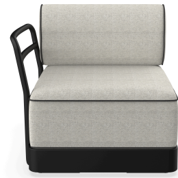
Brisa Terminal Noche Cojin Salina 05 + Dolce 55 06883..1X.