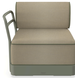
Brisa Terminal Salvia Cojin Limonetto + Fern 06882..1X.