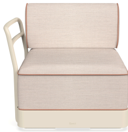
Brisa Terminal Nácar Cojin Hazelnut + Amber 06881..1X.