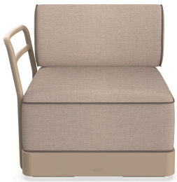
Brisa Terminal Duna Cojin Mud+Mocha 06880..1X.