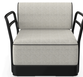
Sillon Brisa Noche Cojin Salina 05 + Dolce 55 06804..1X.