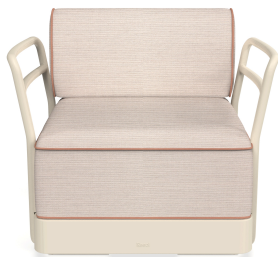
Sillon Brisa Nácar Cojin Hazelnut + Amber 06802..1X.