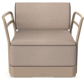
Sillon Brisa Duna Cojin Mud + Mocha 06801..1X.