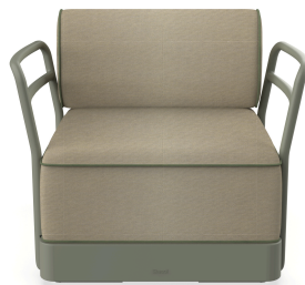
Sillon Brisa Salvia Cojin Limonetto + Fern 06803..1X.