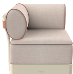
Brisa Corner Nacar Cojin Hazelnut + Amber 06798..1X.