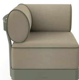
Brisa Corner Salvia Cojin Limonetto + Fern 06799..1X.