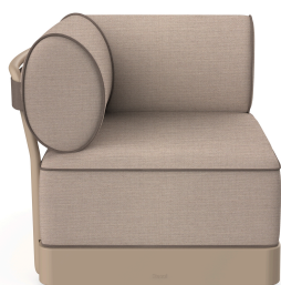
Brisa Corner Duna Cojin Mud + Mocha 06797..1X.