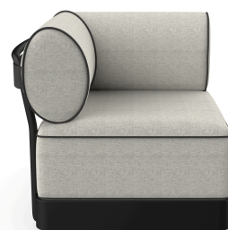
Brisa Corner Noche Cojin Salina 05 + Dolce 55 06800..1X.