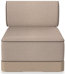
Brisa Basic Duna Cojin Mud + Mocha 06793..1X.