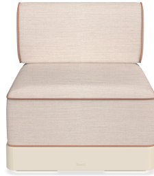
Brisa Basic Nácar Cojin Hazelnut + Amber 06794..1X.