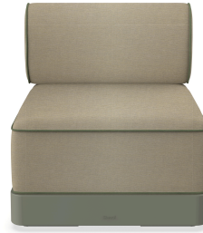
Brisa Basic Salvia Cojin Limonetto + Fern 06795..1X.