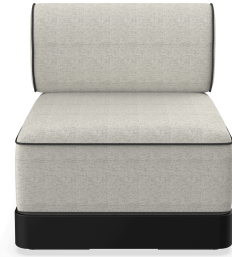
Brisa Basic Negro Cojin Salina 05 + Dolce 55 06796..1X.