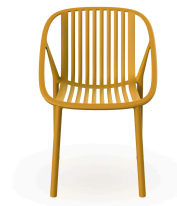
Silla Bini Toscano 05380..4X.