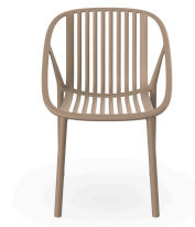
Silla Bini Arena 05381..4X.