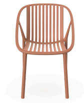
Silla Bini Terra Cotta 05379..4X.