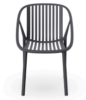
Silla Bini Gris Oscuro 05376..4X.