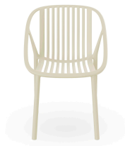
Silla Bini Marfil 05378..4X.