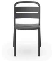
Silla Como Gris Oscuro 05344..4X.