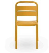
Silla Como Toscano 05348..4X.