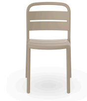
Silla Como Arena 05346..4X.