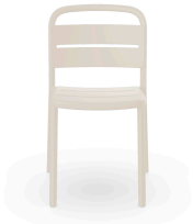
Silla Como Marfil 05343..4X.