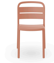
Silla Como Terra Cotta 05347..4X.