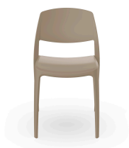
Silla Smart Arena 05366..4X.