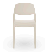
Silla Smart Marfil 07114..4X.