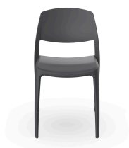
Silla Smart Gris Oscuro 05365..4X.