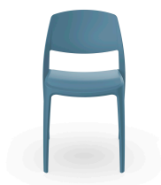
Silla Smart Azul Retro 05367..4X.