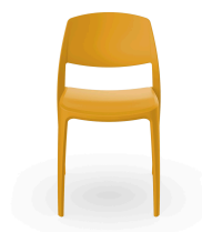
Silla Smart Toscano 05369..4X.