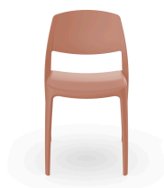
Silla Smart Terra Cotta 05368..4X.