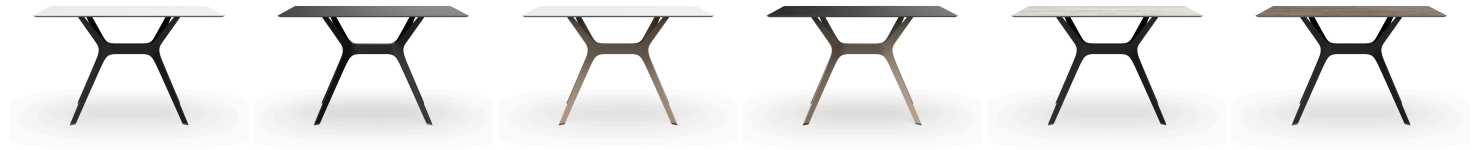
Mesa Vela M 120x80 Negra / HPL Blanco 03094..1X.