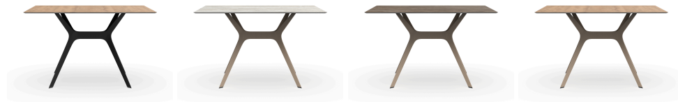
Mesa Vela M 120x80 Negro / HPL Roble Natural 04095..1X.